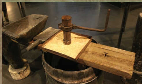
Фото ручних жорен, які селяни виготовляли для перетирання зерна в домашніх умовах. На державних млинах зерно відразу конфісковували. Радянська преса була на сполох, що «в деяких селах їх виявляли сотнями». «Вісті» від 11 січня 1933 р. повідомляли про те, що в одному районі протягом місяця їх було вилучено 755 штук

Дехто намагався провратися через кордон у Західну Україну чи у Молдову. Більшість із них була затримана чи розстріляна на місці природонниками.