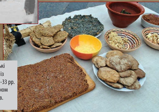
Сурогатні страви періоду Голодомору. У 2012 р. громадські активісти на центральній площі м. Львова накрили стіл із «стравами», які споживали українці під час Голодомору 1932-33 рр. та пропонували частуватись ними всім охочим. Таким чином активісти прагнули нагадати про жахливі події тих років.