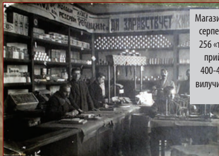
Магазин «торгсіну» в м. Путивль, 1930 р. На серпень 1933 р. в Україні нараховувалося 256 «торгсінів». У середньому через один приймальний пункт щодня проходило 400–450 осіб. Радянська влада за 1932 р. вилучила в українських селян 21 т золота, а за 1933 – 44,9 т.

Декого навіть найстрашніший голод не змусив порушити певні табу, наприклад, їсти мертвих тварин. Інших голод спонукав і на набагато страшніші вчинки.