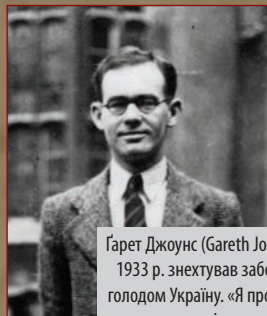
Гарет Джоунс (Gareth Jones), вельський журналіст, у березні 1933 р. знехтував заборонами і таємно відвідав охоплену голодом Україну. «Я пройшов через безліч сіл і дванадцять колгоспів», — напише він після повернення.

Найбільшим жахом Голодомору стала надзвичайно велика смертність серед дітей. Діти помирали раніше за дорослих. Не в силах дивитися, як згасає дитина, батьки везли її до найближчого міста і там залишали — в установах, лікарнях, на вокзалах, просто на вулиці. З притулків діти тікали і виживали жебракуванням та дрібними крадіжками. Найгірше велося новонародженим дітям, адже в матерів часто не було грудного молока.