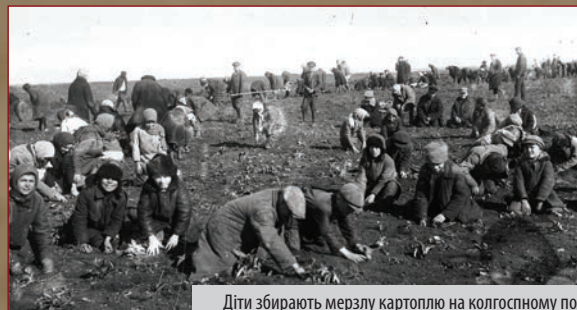
Діти збирають мерзлу картоплю на колгоспному полі с. Удачне Донецької області. 1933 р.

Дехто доносив на сусіда, щоб отримати за це частину його майна, продати його та купити харчі. Записувалися в сільські активісти. Отримана у винагороду частка реквізованого в односельців, дозволяла протягнути якийсь час.