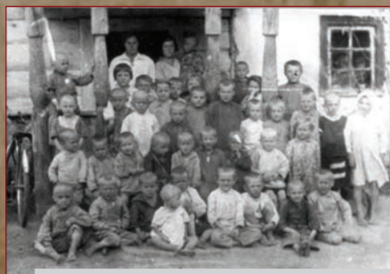
Діти і вихователі дитячого садка колгоспу імені Г. І. Петровського. с. Городище Київської області, 1932 р.