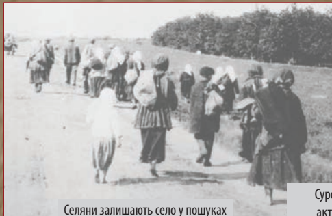
Селяни залишають село у пошуках їжі.